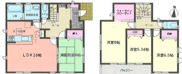
1階平面図:58.80㎡ 2階平面図:47.21㎡ 敷地延長部分3.00m