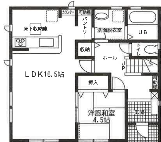
1階平面図: 57.97m 2